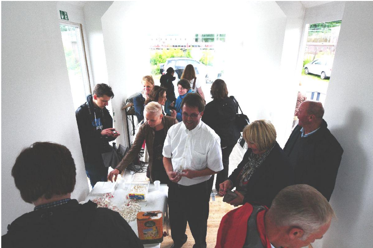
Besucherandrang, das Haus hat symmetrische Hälften, der Eingang ist in der Mitte.