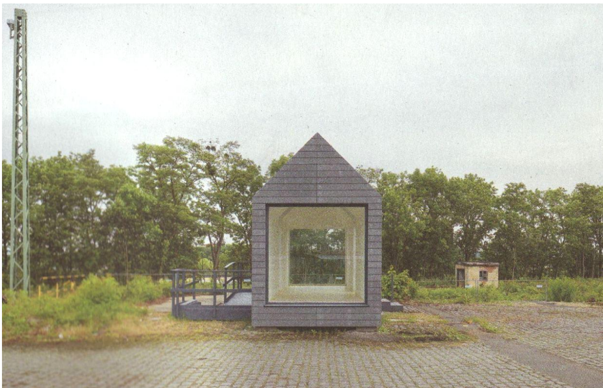
Haus 24: Links eine Rampe, die andere Seite zwei Stufen. Farbgebung schiefergrau.