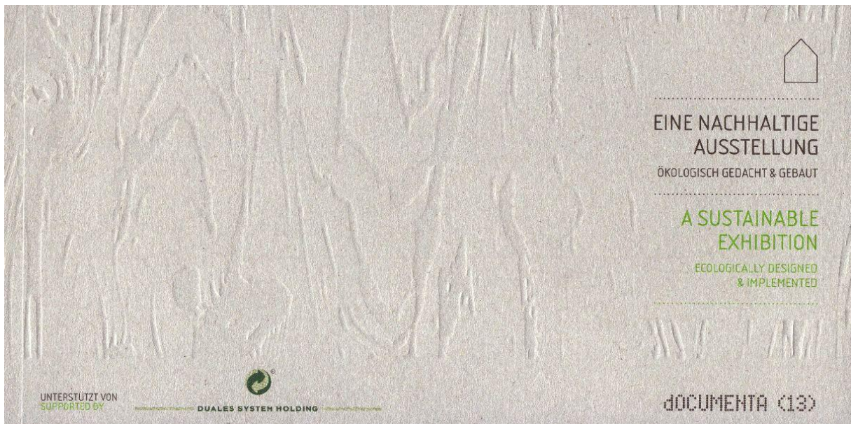
Eine nachhaltige Ausstellung – Deckblatt des DSD Prospekts